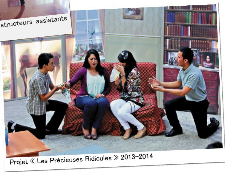
Projet « Les Précieuses Ridicules » 2013-2014

Paris-Tegu étant déclarée d'intérêt général, votre don ouvre droit à une réduction fiscale. Après Réduction d'Impôts, votre don de 15€ ne revient qu'à 5€ !