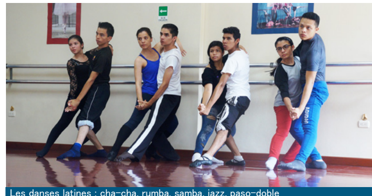
Les danses latines : cha-cha, rumba, samba, jazz, paso-doble

Après avoir mis en place un projet pilote pendant 2 ans au CCAA, nous avons observé que les bienfaits chez les jeunes étaient considérables. La pratique de cette discipline, qui est à la fois un art et un sport très complet, permet de canaliser leur énergie et de transmettre à travers l'action de nouvelles règles de vie en forgeant des valeurs de détermination, de dynamisme, de respect, de solidarité, mais aussi de convivialité. Elle développe la confiance en soi, le goût de l'effort, le dépassement de soi, préserve leur santé physique et leur équilibre mental. Le fait qu'elle se pratique en couple offre un espace rare pour construire