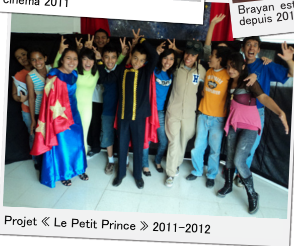
Projet « Le Petit Prince » 2011-2012