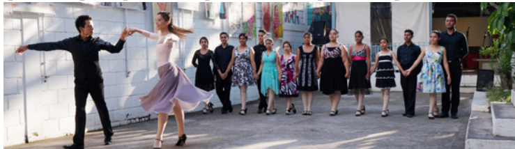
Les danses standards : tango, valse lente, valse viennoise, slow fox-trot, quickstep