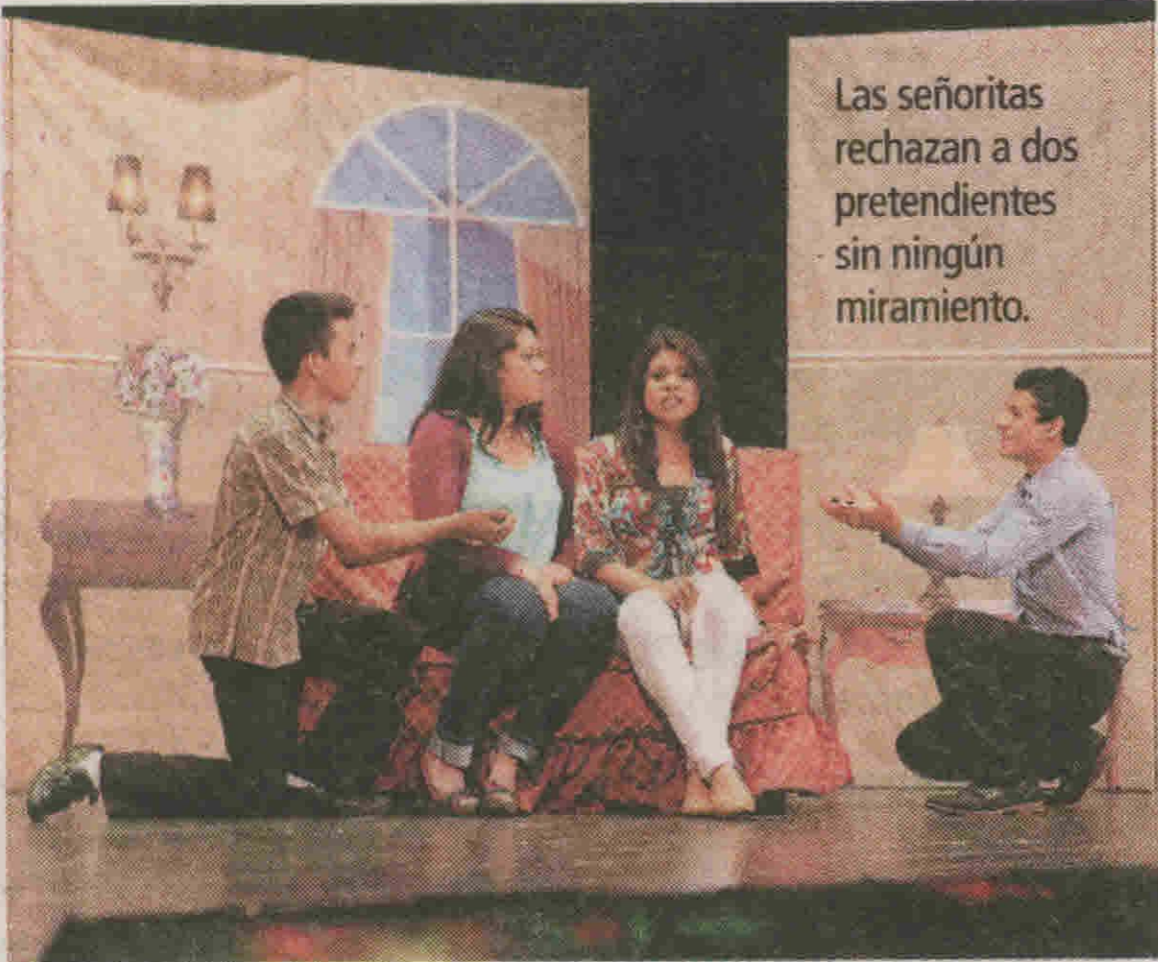
Las señoritas rechazan a dos pretendientes sin ningún miramiento.