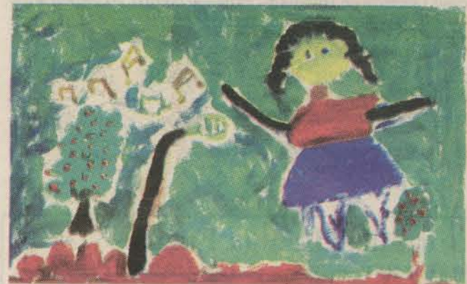
La exposición móvil de proyección artística muestra los trabajos de los niños.