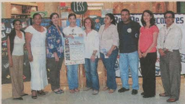
Aproximadamente 2,900 menores de edad son beneficiados con este proyecto, emprendido por ocho instituciones.