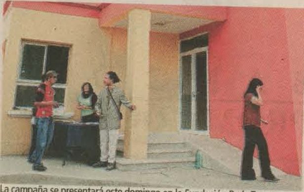
La campaña se presentará este domingo en la Fundación París-Tegu.

Tegucigalpa. Este domingo es el lanzamiento de la campaña de sensibilización "Tus derechos a tu alcance" promovida por la Fundación Cultural París-Tegu, con el apoyo de la Embajada de Francia en Honduras.