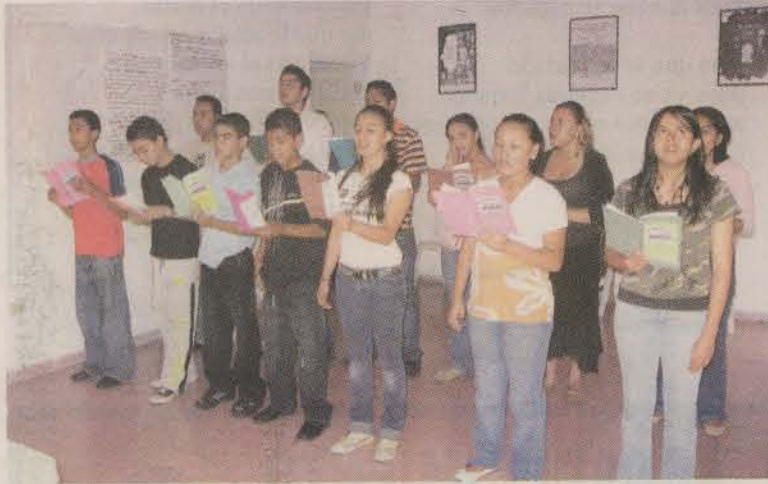
La apertura contará con la participación musical del coro "Arte y Amistad".

Con el propósito crear más espacios culturales en el país, los representantes de la Fundación Cultural París- Tegucigalpa, inaugurarán hoy, a las 2 de la tarde, el "Centro Cultural Arte y Amistad", en Tegucigalpa.