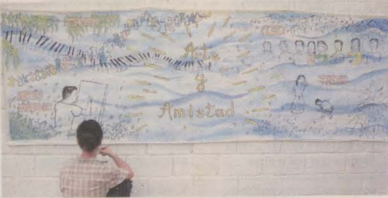
Salón cultural para exposiciones de Artes Plásticas.