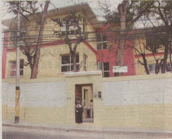
Nuevo espacio cultural en Tegucigalpa bautizado como "Centro Cultural Arte y Amistad".

En presencia de diplomáticos, funcionarios de gobierno, críticos y amantes del arte, las autoridades de la Fundación Cultural Paris-Tegu, inauguraron el "Centro Cultural Arte y Amistad" en Tegucigalpa.