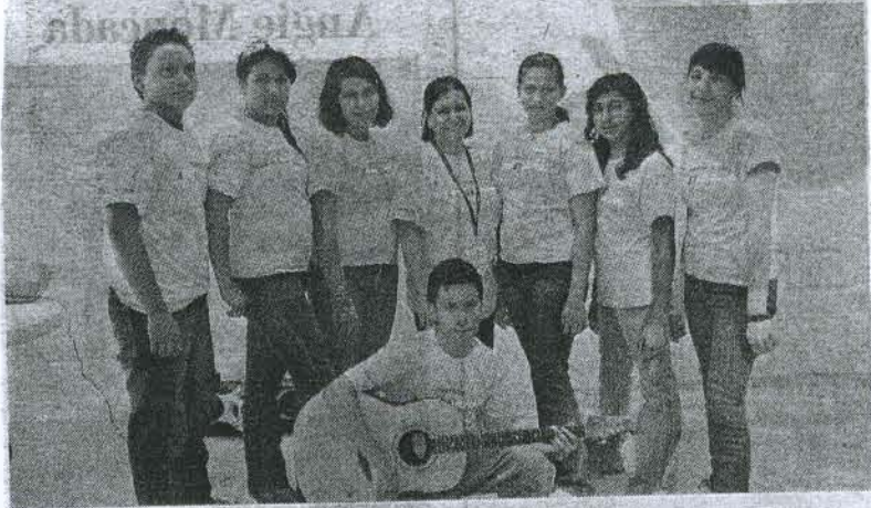
Estudiantes del CCAA mostraron en todo momento sus destrezas artísticas.

Una presentación que incluyó danza, teatro, canto, pintura y otras expresiones artísticas, ofrecieron los talentosos alumnos del Centro Cultural de Arte y Amistad, CCAA, de Tegucigalpa.