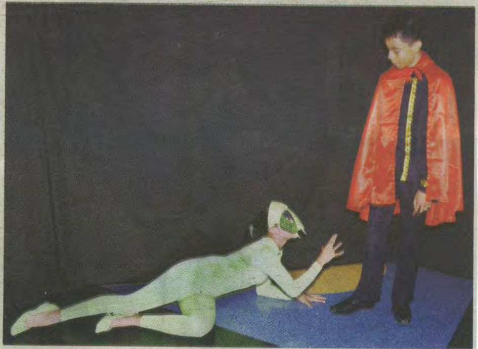
La obra infantil con mensaje humanista se presentó en Chiminike.

de una gira que los actores realizan por los diversos centros culturales de Tegucigalpa, con el fin de contribuir a la divulgación del patrimonio cultural francés.