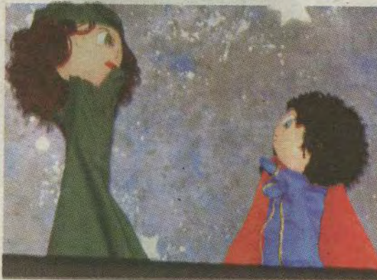
La presentación incluyó un espectáculo de títeres de guiñol.