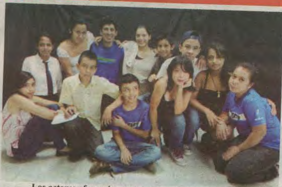
Los actores ofrecerán una tarde con mucha diversión.