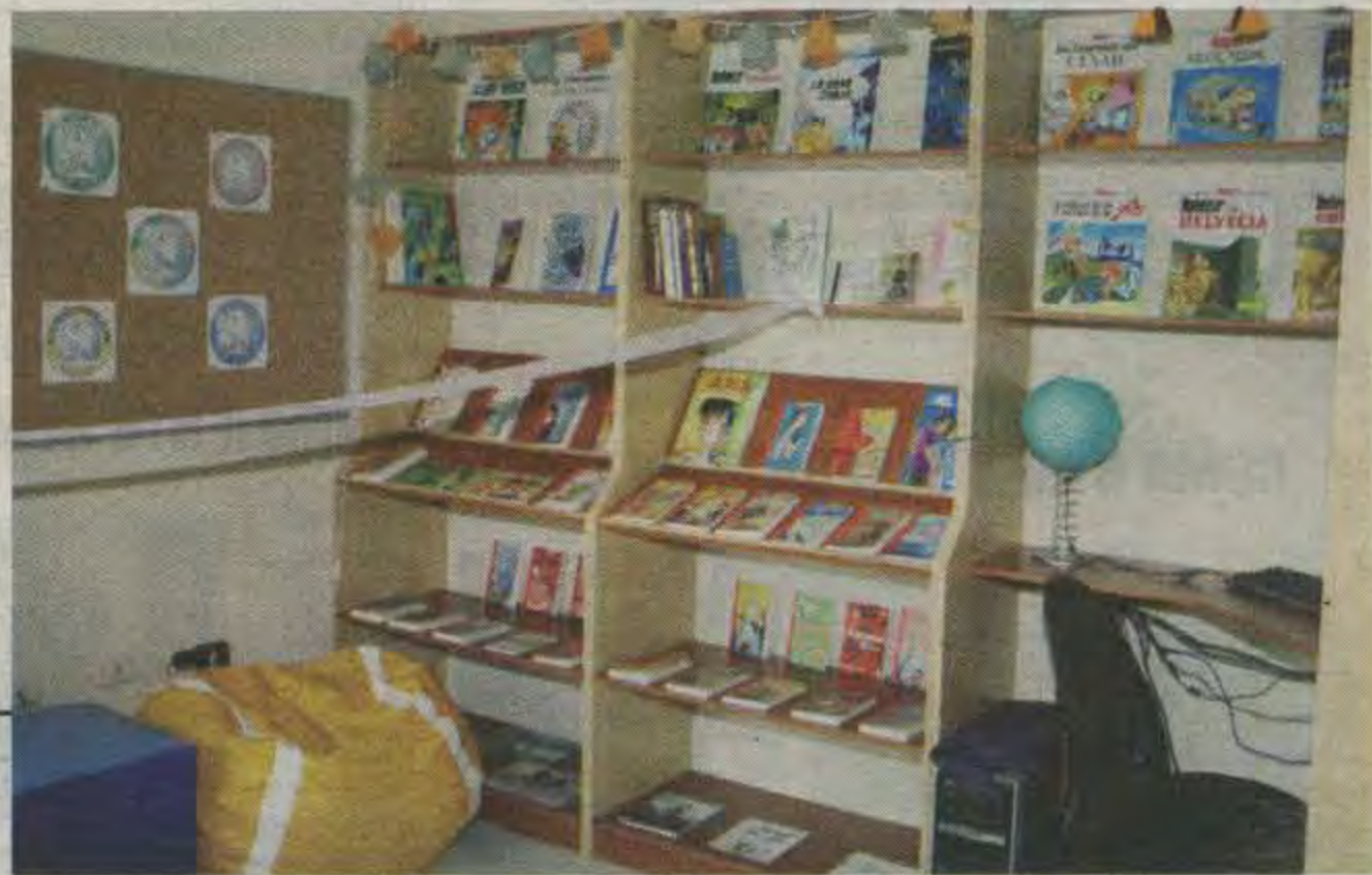
El moderno inmueble está ubicado en la colonia La Reforma de Tegucigalpa.