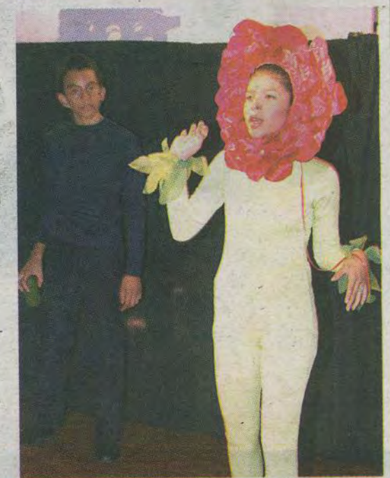
Los actores dramatizaron la historia de un aviador perdido en el desierto de Sahara.