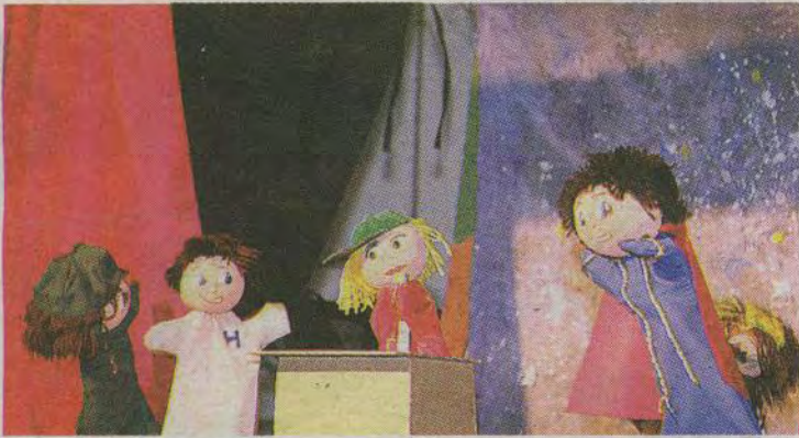
La presentación incluyó un espectáculo de títeres de guiñol.

En la Alianza Francesa de Tegucigalpa cobró vida la obra infantil "El Principito" del escritor y aviador francés Antoine de Saint-Exupéry.