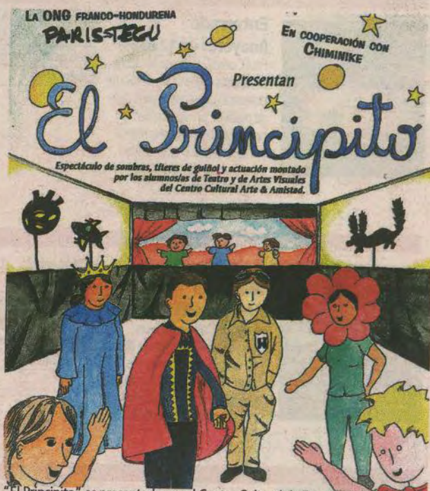
"El Principito" es presentada por el Centro Cultural de España de Tegucigalpa.